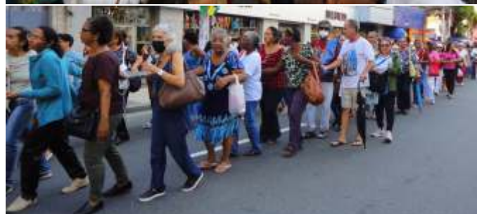
O barco de São Pedro e uma rede foram conduzidos pelos fiéis