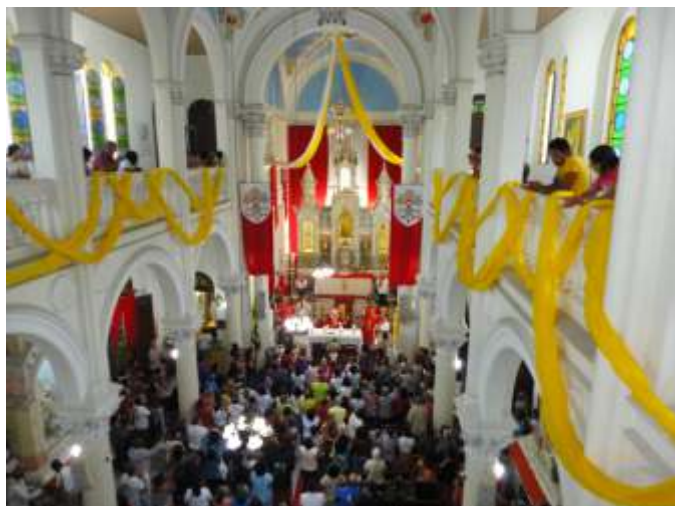
Pela primeira vez, Dom Sérgio celebra na Igreja de São Pedro

delas foram presididas pelos bispos auxiliares de nossa Arquidiocese: Dom Marco Eugênio Galrão e Dom Valter Magno. No final da manhã, houve um momento de louvor conduzido pelo grupo da Renovação Carismática Nossa Senhora do Cenáculo. Após a missa das 12h, houve um momento de Adoração ao Santíssimo Sacramento conduzido pelo Grupo de Mães que Oram pelos Filhos. No meio da tarde aconteceu a procissão, tendo como andor um barco com a imagem de São Pedro, que foi levado pelos fiéis, percorrendo algumas ruas do bairro, retornando à Igreja Matriz, onde foi celebrada a missa solene de encerramento da festa, presidida pelo Cardeal Arcebispo de nossa Arquidiocese, Dom Sérgio da Rocha.